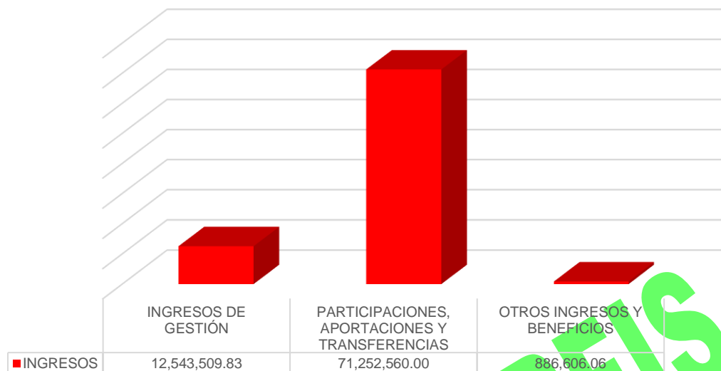
Gráfico 1. Ingresos